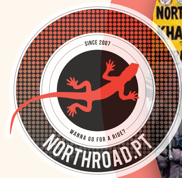
one of our latest expeditions to India

Northroad Unipessoal, Lda Rua de Camões 703 4000-148 Porto VAT: PT508259800